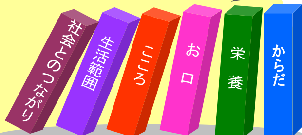
(東京大学高齢社会総合研究機構・飯島勝矢様：作図)

在宅復帰・在宅支援を目標に、 入所サービス、ショートステイサービス、 訪問及び通所リハビリテーションサービスの 各チームが支えます。